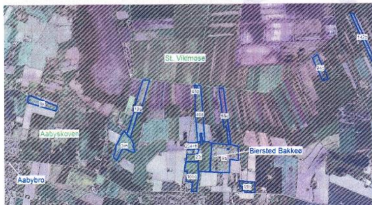
Figur 1 Matriklerne for den planlagte skovrejsning og udlæggelse til lysåben natur

Projektet er et skovrejsningsprojekt på 14 forskellige matrikler i området nær Biersted og Aabybro ved Store Vildmose. Se bilag med oversigtskort i størrelsesforholdet 1:25000, hvoraf nedenstående figur er et uddrag. Matriklerne er på nuværende tidspunkt i landbrugsmæssig drift. På to af matriklerne, 6a og 23 i Biersted By, Biersted, er der bebyggelse i form af gårde og landbrugsdriftsbygninger.